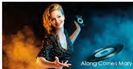
Along Comes Mary