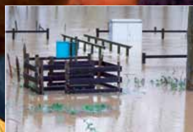
Hevige regenval november 2010 erkend als ramp p. 3