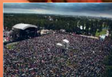
Met de bus naar Rimpelrock p. 12