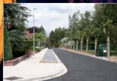
Waterbeheersingswerken Lauwe p. 7

Straattheaterfestival ZOMER in Menen en Lauwe zie binnenin