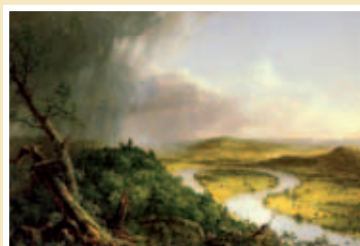
Thomas Cole: The Oxbow (1836)

Wat men ziet is mooi, nooit brutaal, vaak verrassend. De beelden lijken irreal omdat ze iets weerspiegelen. Het geheel krijgt al gauw iets surrealistisch door de beweging van het water.