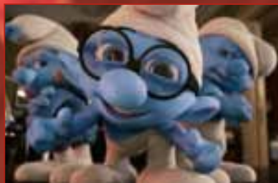
De Smurven in De Steiger