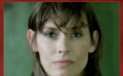
Gedichtendag 2012 ook in de bib p. 13