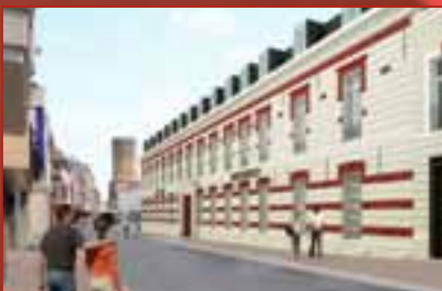
De projecten voor 2012 in de kijker p. 9

Kom naar de Nieuwjaarsreceptie op zaterdag 7 januari zie p. 10